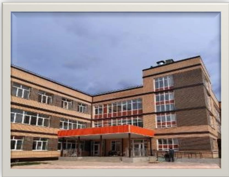
Новое здание школы №1 2022г

Новейшая страница истории школы была открыта в ноябре 2019 г. Именно тогда был дан старт строительству школы №1 на 520 учащихся. А закончилось строительство в 2022 году - настоящим подарком для педагогов и учеников - в ноябре школа празднует свой 205-летний юбилей!