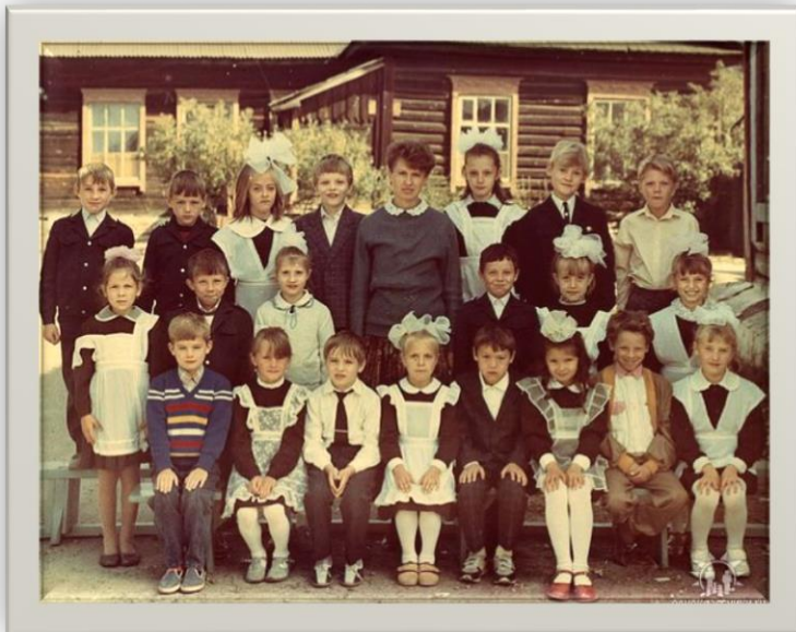
Учащиеся школы №1