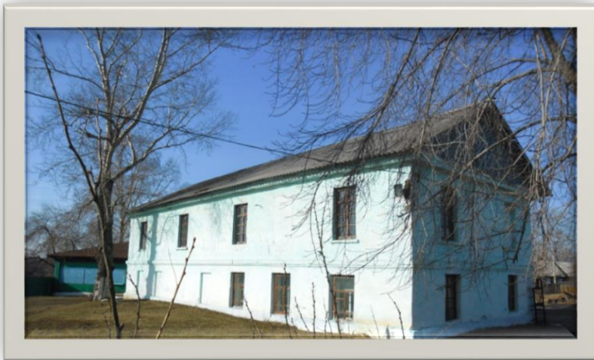
Мастерских для мальчиков, бывшее здание уездного казначейства

Мастерскими школы стало здание бывшего казначейства.