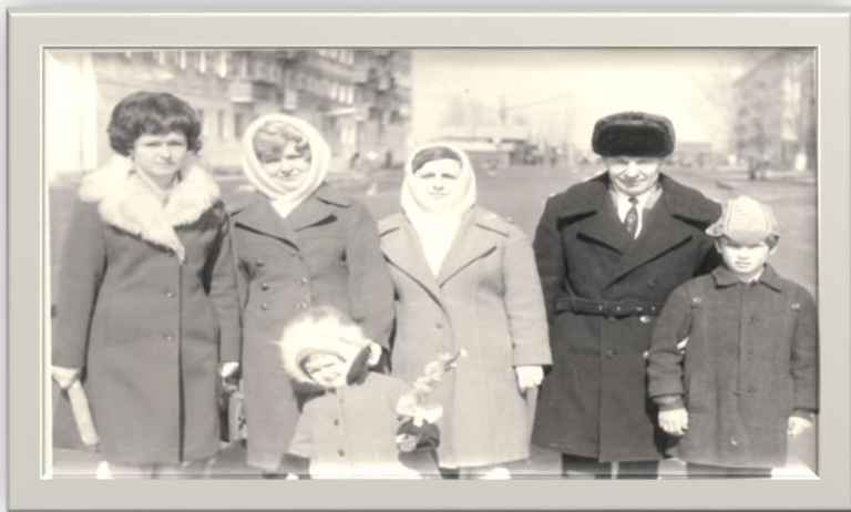
Коллектив учителей школы №1