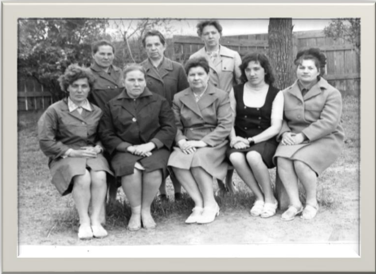
Коллектив учителей начальных классов 1974г