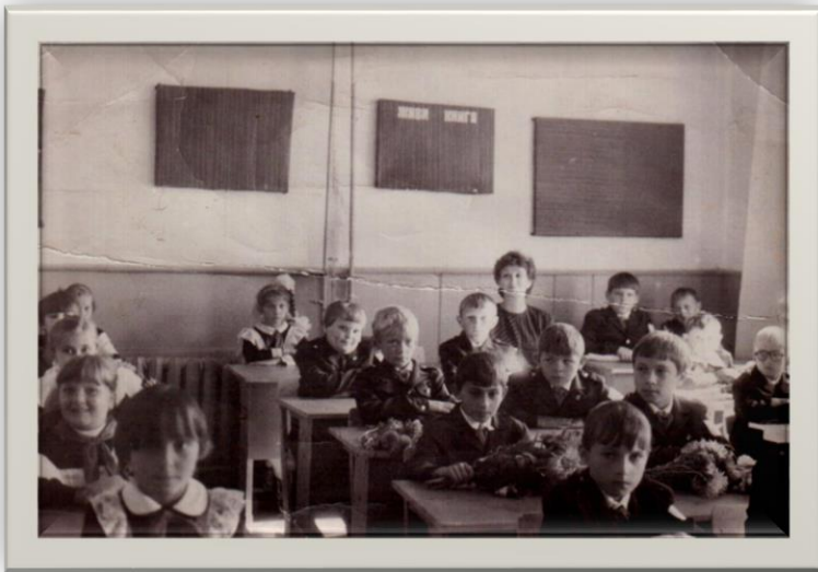
Учащиеся школы №1