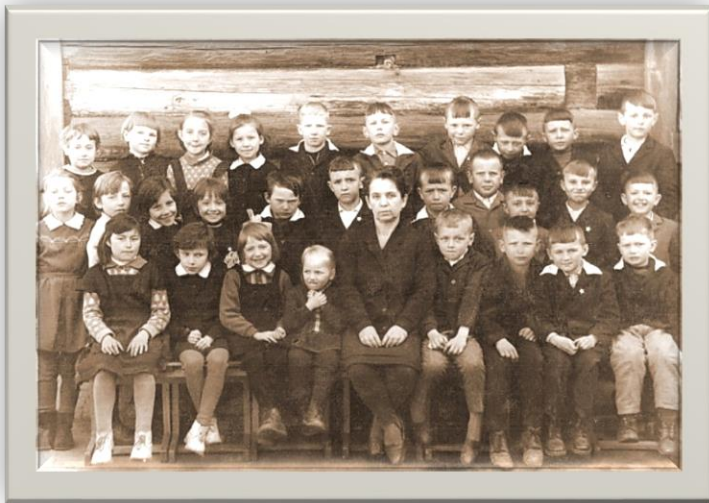
Учащиеся 1 класса