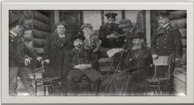
Учителя одного из уездных училищ

Предметы, изучаемые в уездном училище: 1) Закон Божий и Священная история; 2) должности человека и гражданина; 3) российская грамматика, а в тех губерниях, где в употреблении другой язык, сверх грамматики российской изучалась грамматика местного языка; 4) чистописание; 5) правописание; 6) правила слога; 7) всеобщая география и начальныя правила математической географии; 8) география Российского государства; 9) всеобщая история; 10) российская история; 11) арифметика; 12) начальныя правила геометрии; 13) начальныя правила физики и естественной истории; 14) начальныя правила технологии, имеющия отношение к местному положению и промышленности; 15) рисование. Методика преподавания была несовершенна, применялось механическое заучивание.