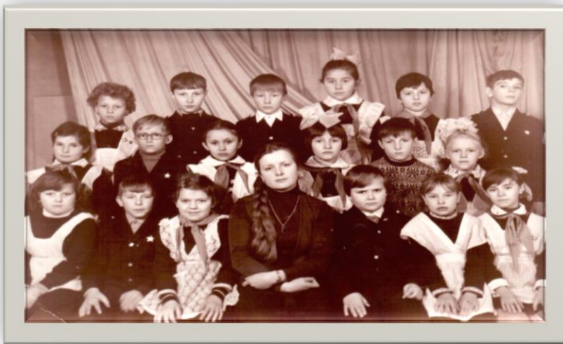
Учащиеся школы №1