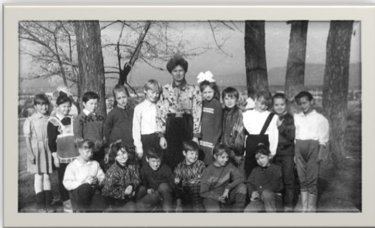
Учащиеся школы №1