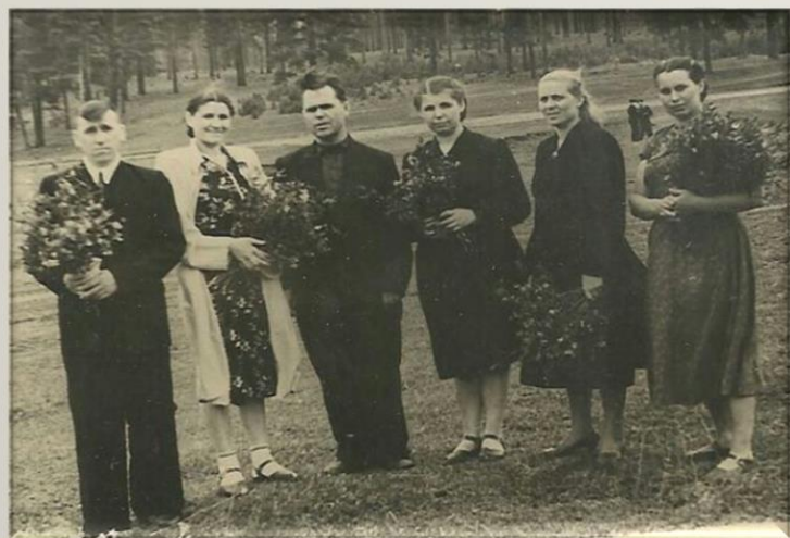
На экскурсии 25 мая 1956г. с классами. Урочище Бухор.