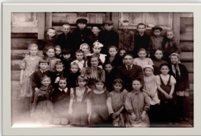
Учащиеся 3 класса 1949 г