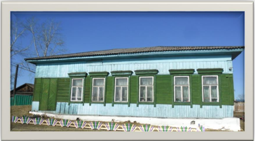
Дом Штатного смотрителя (позднее школьная библиотека)

Рядом стояла одноэтажная постройка – дом Штатного