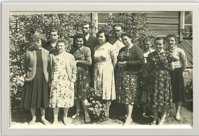
Коллектив учителей школы №1 1959 г