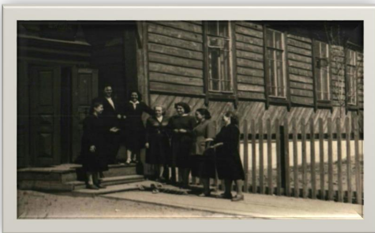
Учителя на крыльце школы 60-е годы