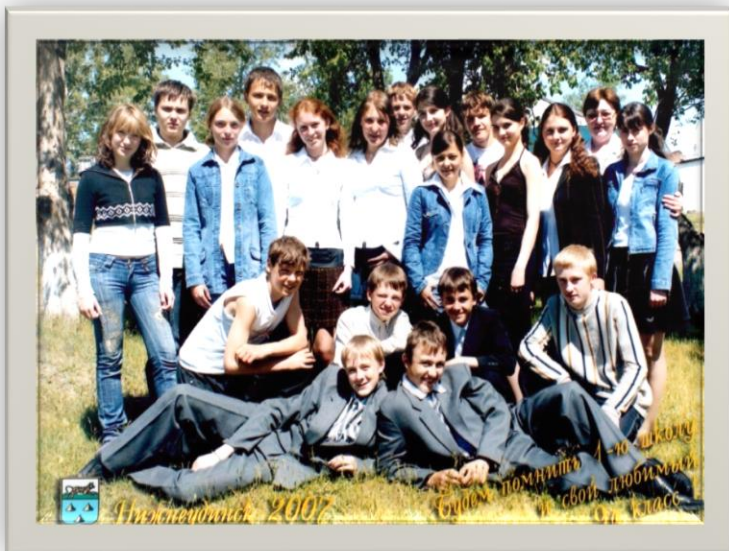
Выпускники 9 класса школы №1 2007г