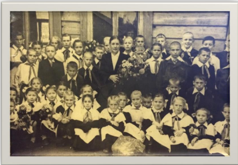
Учащиеся 4 класса 1959 г