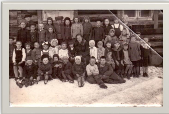
Учащиеся 1 класса 1947г