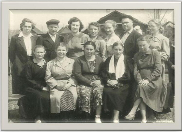
Коллектив учителей примерно 1959г