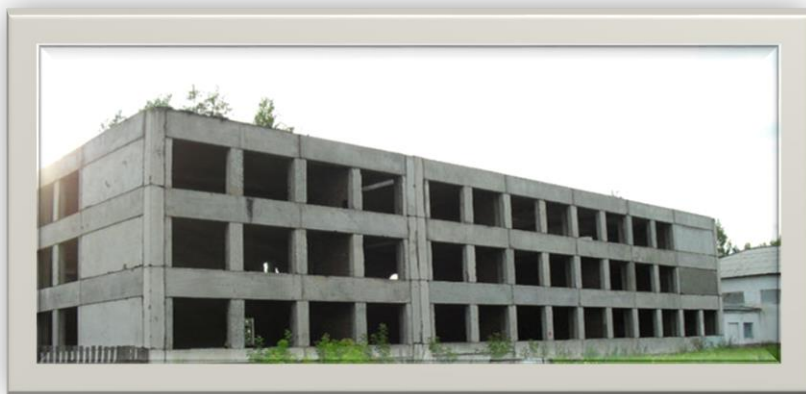
Каркас школы в 80-х годах 20 в

Во второй половине XX в. численность учащихся школы возросла и было принято решение построить большую типовую школу; заложили фундамент, появился остов школы, но в силу разных причин дальнейшее строительство было остановлено.