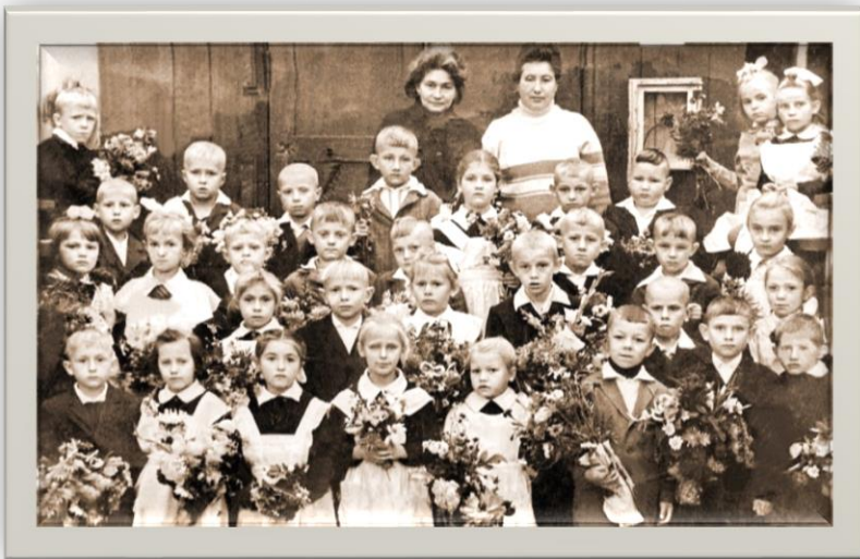
Учащиеся 1 класса школы №1